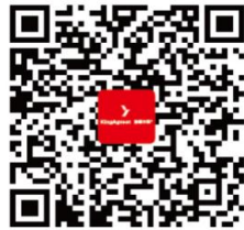
清原农冠 企业介绍视频