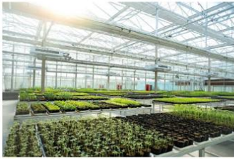
生测及抗性研究中心