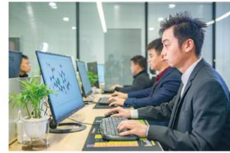
化学研发管理软件中心

截止到 2022 年 1 月底，清原集团已申请中国发明专利 191 件，已授权 85 件；已申请 PCT 国际发明专利 113 件，通过 PCT 途径或巴黎公约途径进入世界各国累计达 1013 件，累计已有 162 件获得授权。